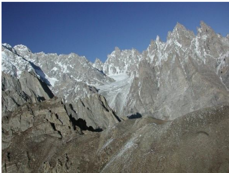
Photo prise lors de notre deuxième vol au dessus de la vallée de Hounza. Altitude 4300m.

Endroits visités, Gilgit et Chitral que nous avons survolé l'année passée seront aussi les but de mon voyage de cette année. Surtout Chitral qui me paraît plus propice que l'austère Hunza. Voici quelques photos de cette superbe aventure.