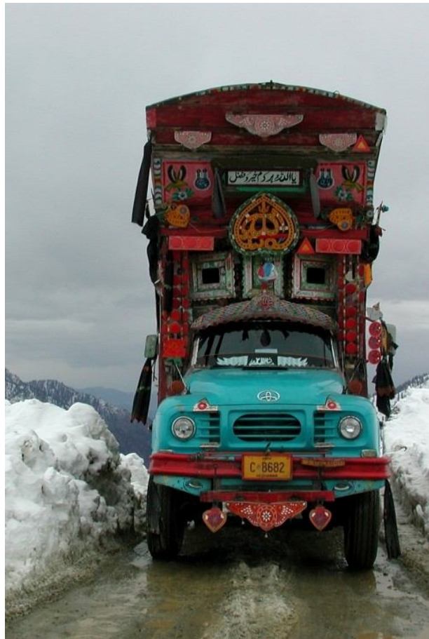
Beau comme un camion, sur le Lovari Pass