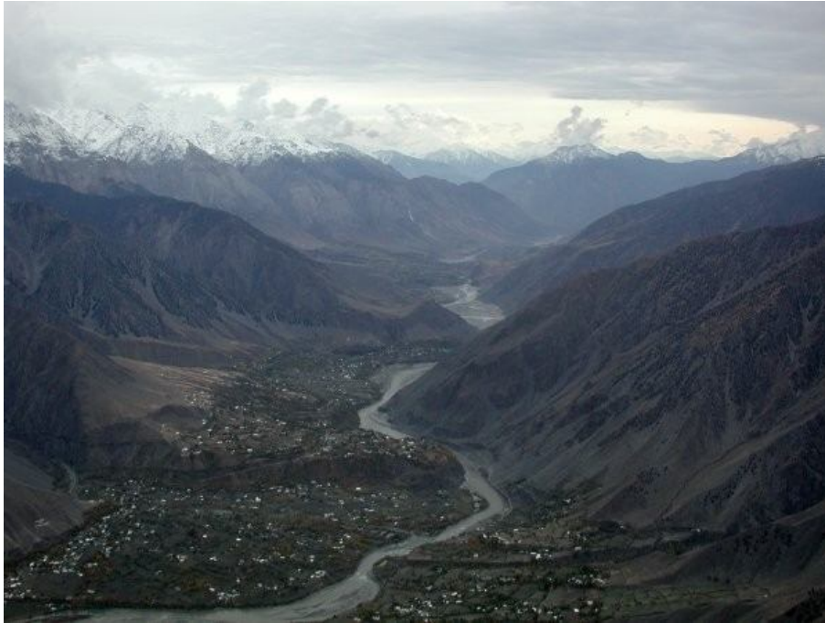
Traversée de la vallée de Chitral. Au fond à gauche le Lovari Pass.